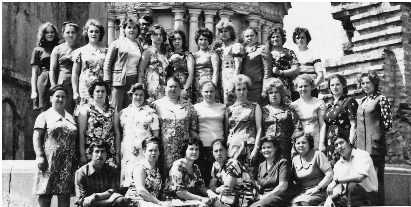
На экскурсии. Печерская Лавра. 1976 год.

Хочешь жить со временем вместе, выписывай и читай «Думиничские вести».